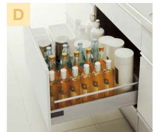
ベースキャビネット(2段目引出し)