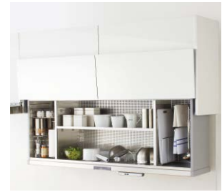
オートムーブシステム