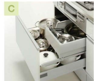
コンロキャビネット(上段引出し)