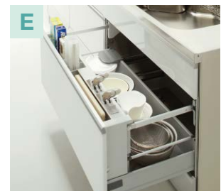
シンクキャビネット(上段引出し)