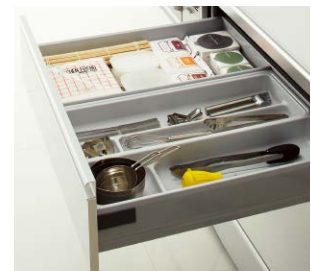
ベースキャビネット(1段目引出し)